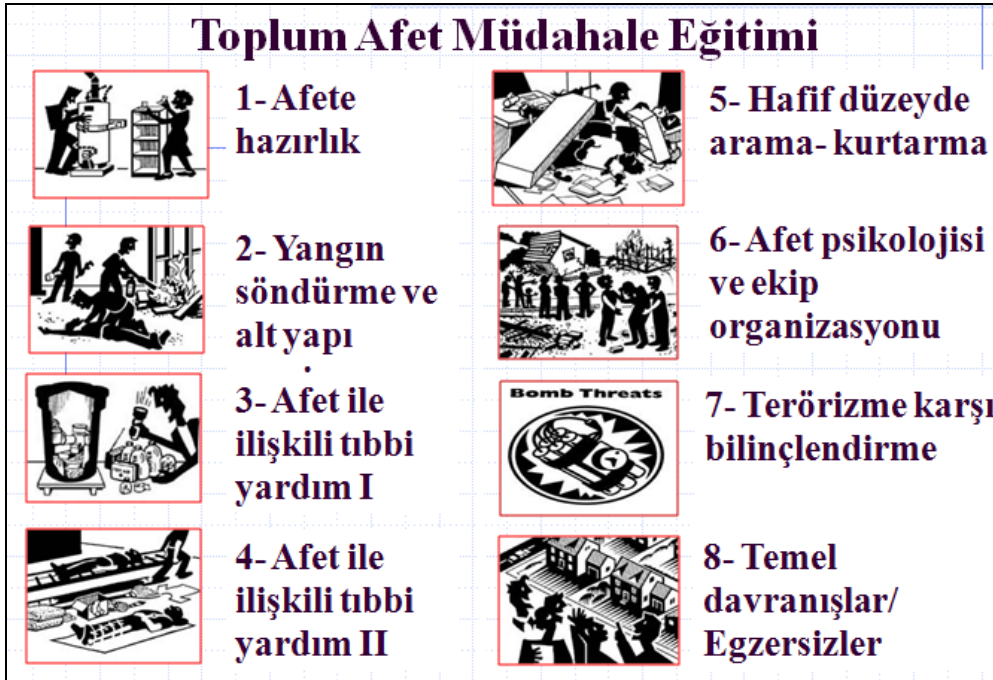
Şekil 5. Ülkemizde yaygınlaştırılması gereken yerel, toplum afet müdahale eğitiminin evrensel ölçütlerde kabul edilmiş toplum afet müdahale eğitiminin adımları ve içeriği.

Özelde Sivil Toplum Kuruluşu (STK) ve Afet Gönüllüleriyle birlikte, genelde tüm toplumun eğitiminde, öncelikle toplumdaki eğitimde kaynaklara sahip tüm kurum ve kuruluşların belirlenmesi büyük önem taşır. Bunun STK’lar ve gönüllüler kendileri için belirledikleri rollere göre toplumumuzdaki potansiyel eğitim kaynaklarının bir listesini çıkartmalıdır. Toplumdaki mevcut eğitim kaynakları konusunda çok seçici davranılmalı ve bu listedeki eğitim daha sonra nitelik ve nicelik yönünden değerlendirilmelidir.